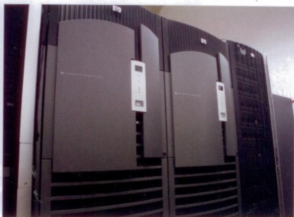
HP Integrity SX2000 Superdome.