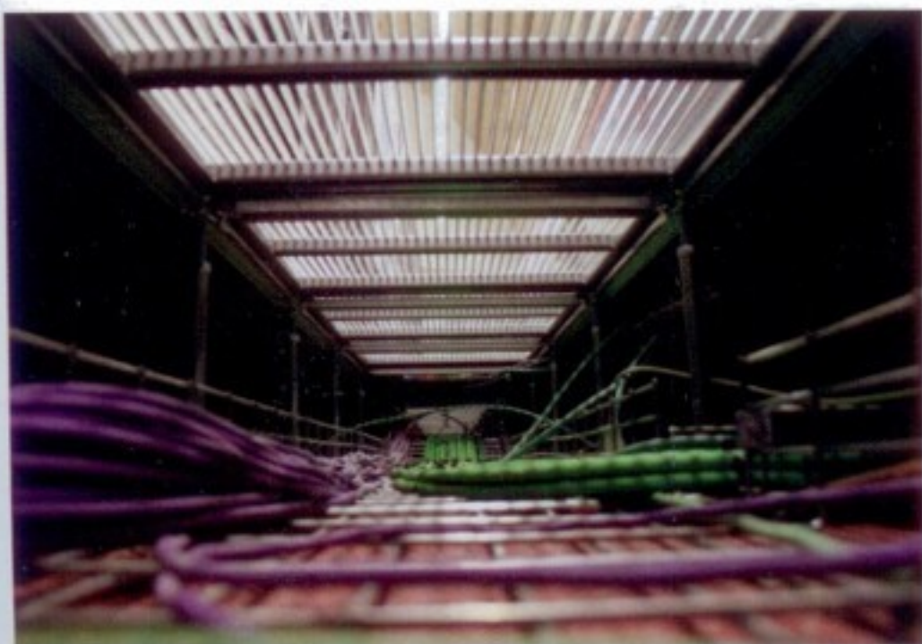
Cableado de Lusitania bajo el suelo.

Paralelamente, el CénitS realiza funciones de host y almacenamiento y presta sus sistemas de comunicaciones de alto rendimiento para el sistema de la Universidad de Extremadura (UEX) desarrollado por HP y Microsoft. Es una iniciativa concebida para acercar cloud computing a los alumnos que desarrollan sus proyectos de fin de carrera. Tanto HP como la Escuela Politécnica de Cáceres, junto a la Fundación COMPUTAEx y Microsoft, han puesto a su disposición la infraestructura necesaria. Los dos proveedores han dotado a la UEX de dos chassis C7000 HP BladeSystem Matrix y las herramientas Insight Dynamics; así como la plataforma de virtualización Microsoft Hyper V que forma parte del sistema operativo Windows Server 2008 R2.